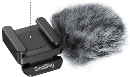
Cold Shoe Mount 冷靴座